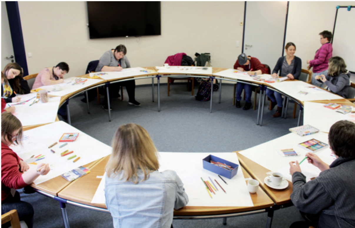
Die Teilnehmerinnen und Teilnehmer des Mitmach-Angebots: Starke Hände – Bunte Hände

Unsere Hände können uns stark sein lassen! Selbst wenn die Stimme versagt, unsere Hände können ausdrücken, was wir meinen und sagen wollen!