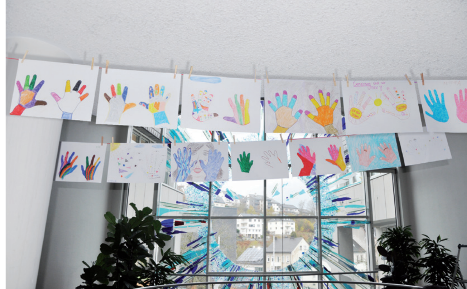
Oben: Die Bilder der Teilnehmerinnen und Teilnehmer

Alle Teilnehmerinnen und Teilnehmer haben ihre Hände auf ein Blatt Papier abgezeichnet. Sie haben ihre Hände nach ihren Vorstellungen bunt bemalt oder etwas hineingeschrieben.