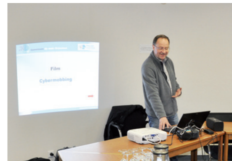
„Gewalt im Internet“ mit Kriminal-Haupt-Kommissar Stefan Didam